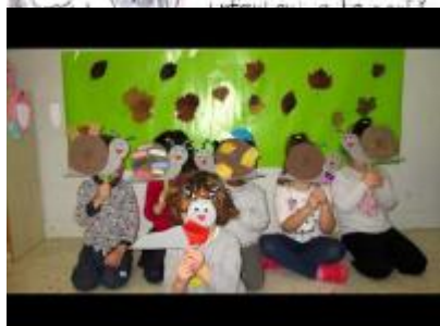
Giornata della disabilità sez. gialla fontanili