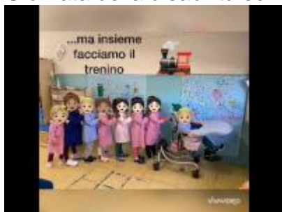
Giornata della disabilità plesso di via Caravaggio