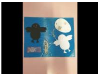
Giornata disabilità Team Rosso Circuito sud