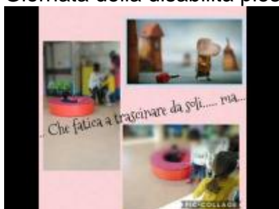
Giornata della disabilità arcobaleno fontanili