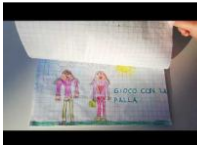
Giornata della disabilità cl. 1^A1