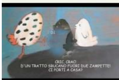
Giornata disabilità Team Rosso Circuito sud