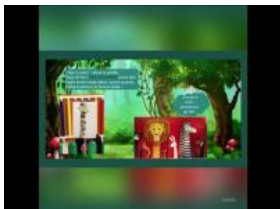
Giornata della disabilità sez. blu fontanili