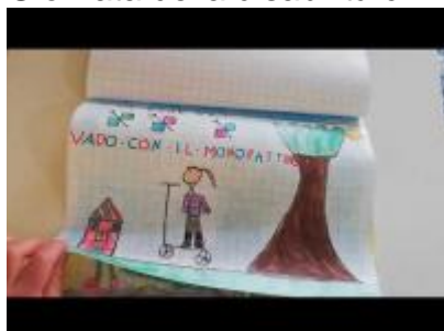
Giornata della disabilità cl. 1^A2