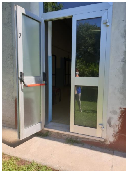
Accesso dal cancello 2