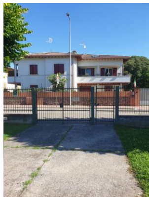
Cancello 3 Via Circuito Sud

Codice Meccanografico: BSIC8AJ00Q – Codice Fiscale: 80053710176 – Codice Univoco: UFV995