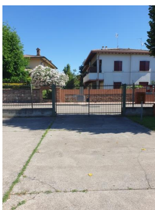
Cancello 2 Via Circuito Sud

SI UTILIZZA LO STESSO INGRESSO PER TUTTE E TRE LE SEZIONI, UNA VOLTA ALL'INTERNO DEL CORTILE, SI SEGUIRANNO PERCORSI DIVERSI PER RAGGIUNGERE LE SINGOLE SEZIONI, UTILIZZANDO INGRESSI LATERALI ESTERNI.