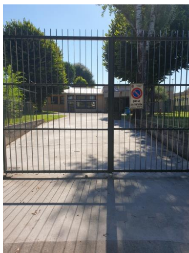
Cancello 1 Via Fontanili

SI UTILIZZA LO STESSO INGRESSO PER TUTTE E TRE LE SEZIONI, UNA VOLTA ALL'INTERNO DEL CORTILE, SI SEGUIRANNO PERCORSI DIVERSI PER RAGGIUGNARE LE SINGOLE SEZIONI, UTILIZZANDO INGRESSI LATERALI ESTERNI.