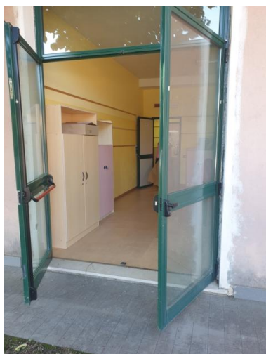
Accesso dal cancello 2

Codice Meccanografico: BSIC8AJ00Q – Codice Fiscale: 80053710176 – Codice Univoco: UFV995