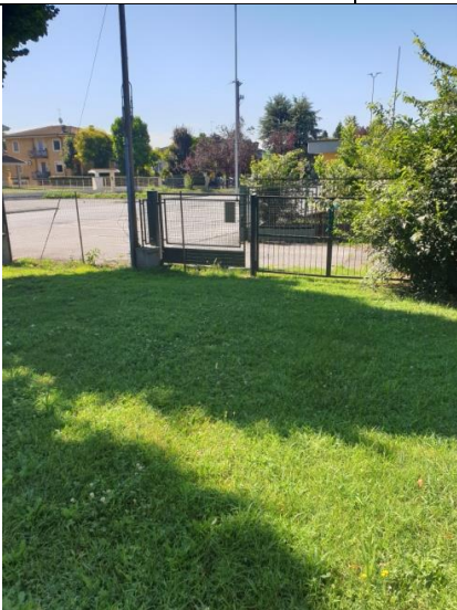
Cancello 2 Caravaggio ( presenza di un Collab sc.)