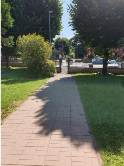
Cancello1 Caravaggio(presenza di un Collab.sc.)